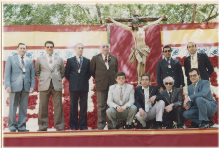
Primera ofrenda con al imagen del Cristo el Criado, 1984.